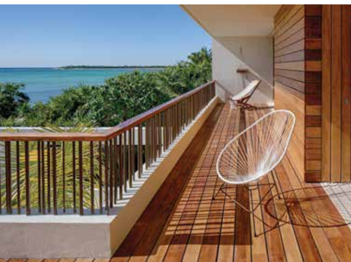
DIE ROMANTISCH GEPLANTEN Sitznischen mit den handbemalten Keramikfliesen aus der Region haben einen ganz besonderen Charme