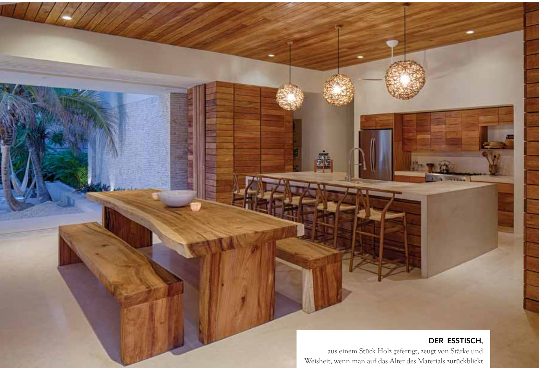
DER ESSTISCH, aus einem Stück Holz gefertigt, zeugt von Stärke und Weisheit, wenn man auf das Alter des Materials zurückblickt